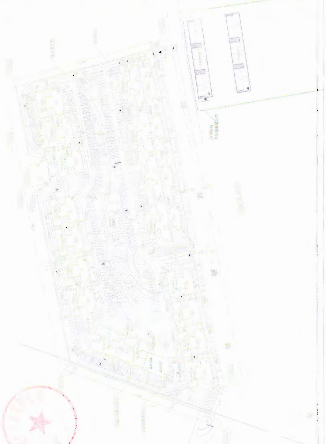
圖 1-1 某建築工程平面圖